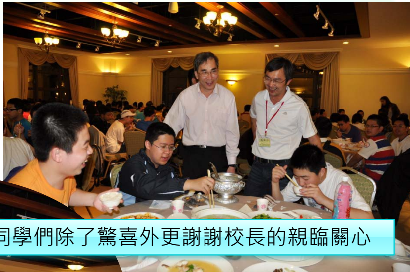
校長逐桌和同學打招呼並叮嚀同學多加餐飯，同學們除了驚喜外更謝謝校長的親臨關心