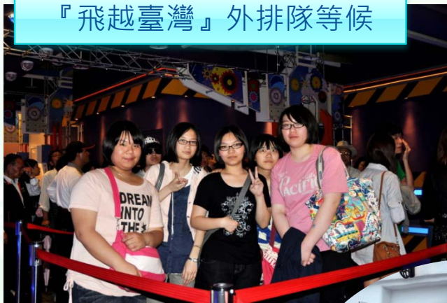
『飛越臺灣』外排隊等候