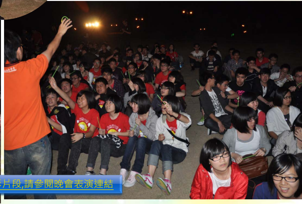
另有三段錄影片段,請參閱晚會表演連結