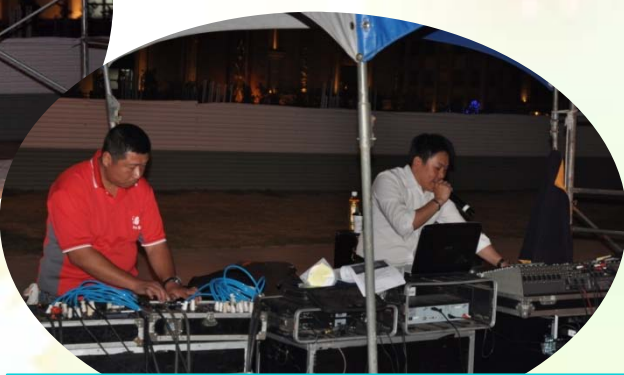
兩位辛苦的主持人與DJ