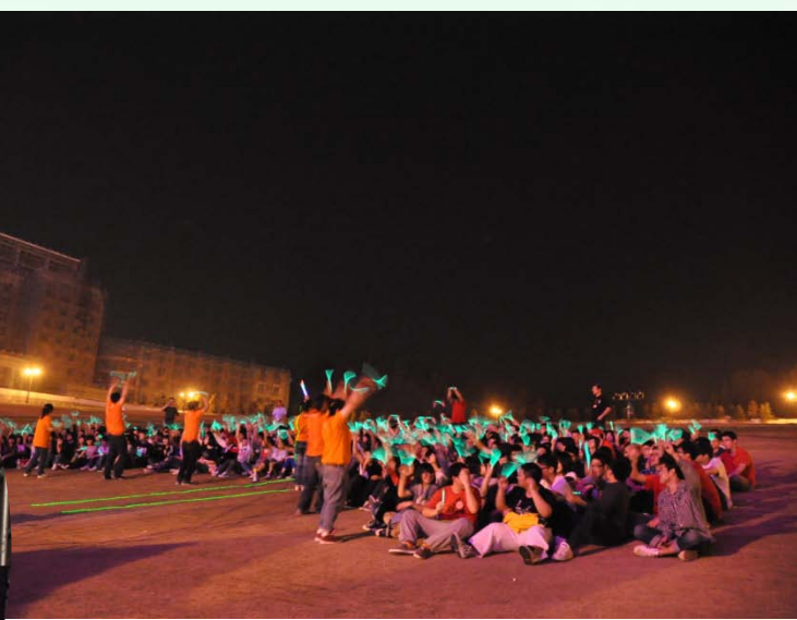
校長致詞祝福同學有個歡樂難忘晚會