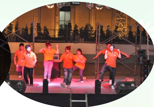
同學們優美歌聲與活力舞蹈的表演