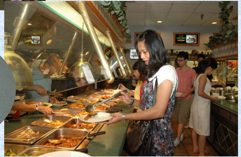
惠君老師說她要節制,所以只吃三盤而已