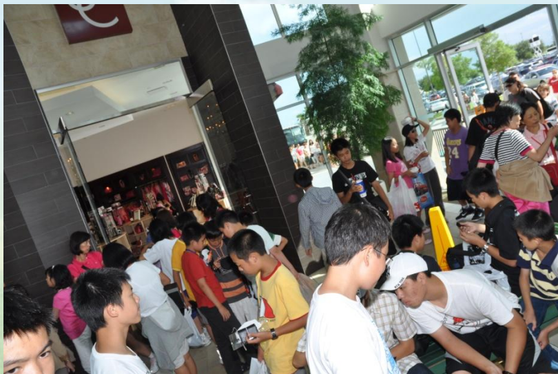
終於買到iPad 4 的同學分享喜悅, 大家討論著戰利品