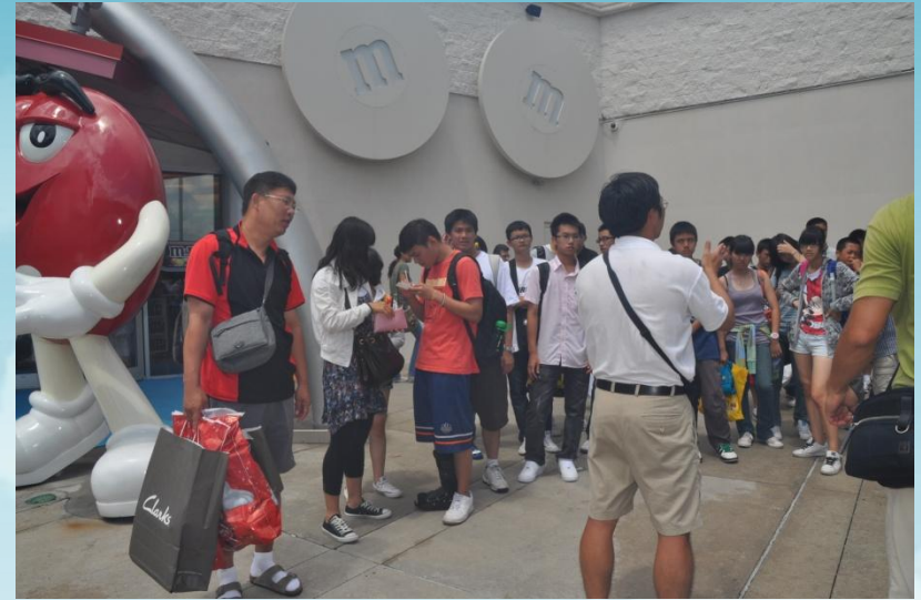
仔細看搭第一班飛機來的顏組長手上...