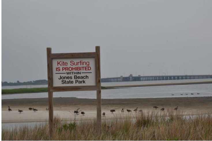
成群野雁在此棲息