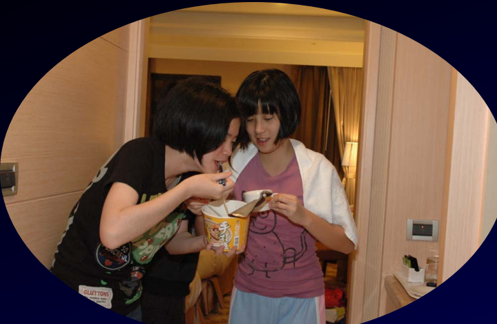
先補充體力, 來碗泡麵...