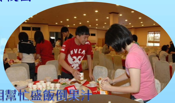
同學互相幫忙盛飯倒果汁